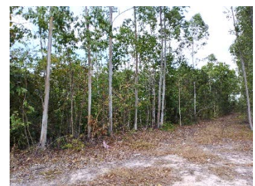
แนวเขตไม่ทำเหมือง