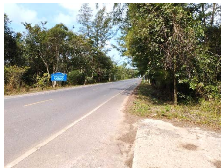
เส้นทางเข้าสู่พื้นที่โครงการ